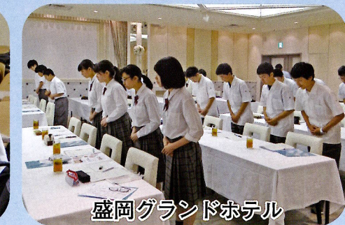
盛岡グランドホテル