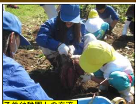
子羊幼稚園との交流