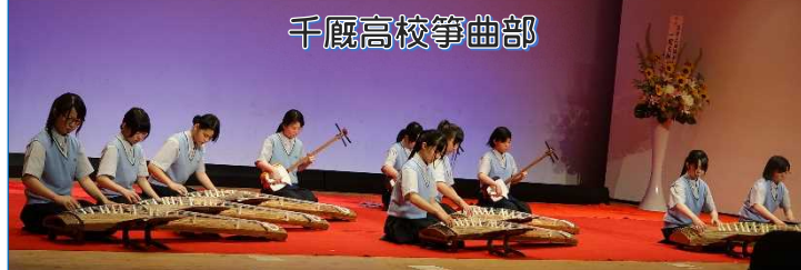
【図 7】千厩高校箏曲部による「オーロラ」の演奏