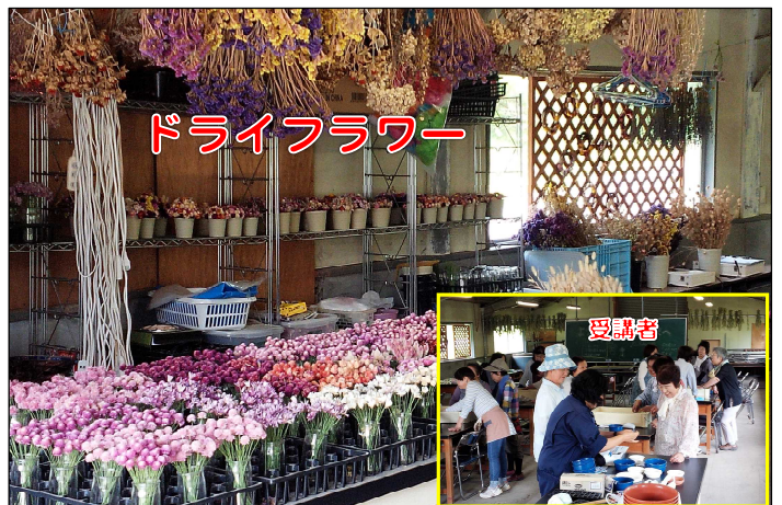
【図4】千厩里山塾「花のまちづくり」コース研修の様子(平成27年6月23日)