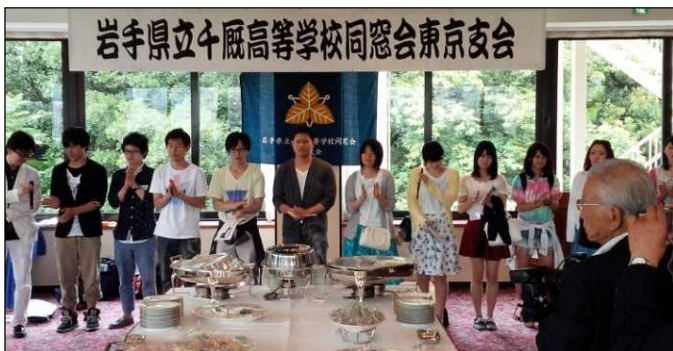
【図2】新卒者激励の様子