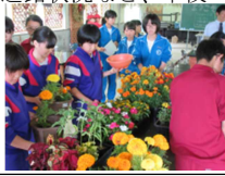
【図 5】左図：枝豆の定植(第 3 回体験入学時に収穫)、右図：花の寄せ植え

8 校 40 名の中学生が本校を訪れ、枝豆の定植と寄せ植えを楽しく体験しました。この体験入学を通して、コース制(生産科学&生活科学)の特徴、行事、資格取得、そして進路状況など、本校生産技術科の特色ある教育活動を知り、認識を新たにしたい生徒さんがほとんどでした。またお会いできることを楽しみにしています。