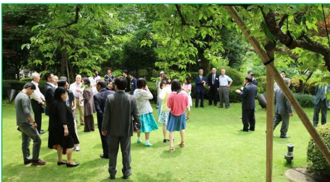
【図1】若葉が美しい会場の庭で記念撮影 (2015/6/14)

母校の発展を願う気持ちは全ての同窓生に共通です。また、毎日の教育活動を通して子供たちを育てる我々教職員に対し温かいエールをいただきました。そのお心遣いに心より感謝いたします。