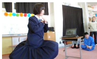
すてきなダンス披露