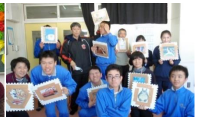
ざぶとんとりゲーム by 和将