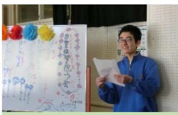
アドリブがナイスな司会