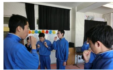
佳汰シェフのロシアンたこ焼き