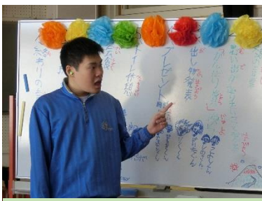
剛作 似顔絵付きの次第

『卒業・進級を祝う会』が3月1日(水)に開催されました。この会に向けそれぞれに出し物の準備に勤しみ、料理の腕に磨きをかけてきました。みんながめざしたものは「みんなのでっかい笑顔！」1年間の思い出と2年生は来年頑張りたいこと、3年生は高校生に向けての抱負を発表しました。出し物披露では準備の努力が実り、感動と笑いの楽しい時間を過ごすことができました。