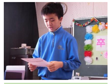
来年がんばりたいこと