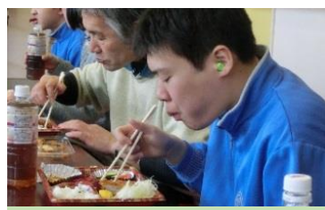
特大とんかつ弁当