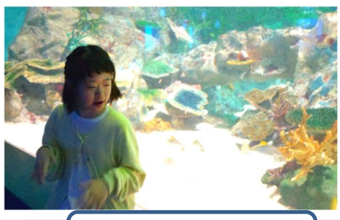
海の中にいるみたい！