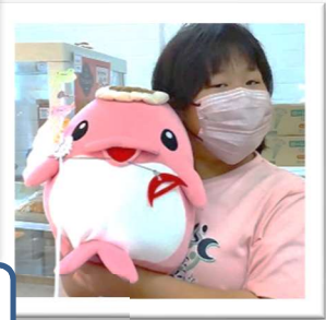
みんな大好き 浅虫のアイドルこころちゃん♪