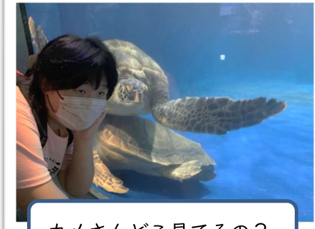
カメさんどこ見てるの？