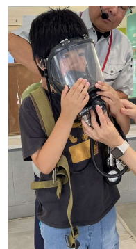
盛岡市中央消防署