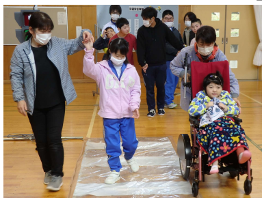
プレイルームで、横断歩道の歩き方の練習

4月19日(水)、奥中山駐在所の警察官の方や交通指導員のみなさんから、道路や横断歩道の歩き方、学校周辺の危険な場所を教えてくださいました。信号機や車、人、自転車などしっかり周りを見て歩くことが大切だと、実際に体験し、知ることができました。2回目(1月)の交通安全教室では、雪道の歩き方を学習する予定です。