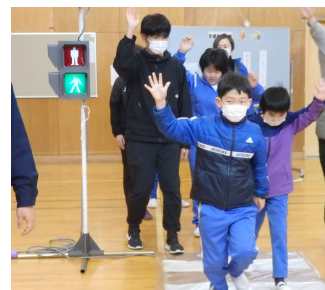
学校周辺の道路や横断歩道の歩き方の練習