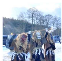
2022. 1. 12付【洋野町の林郷地区に伝わる小正月の伝統行事「なもみ」】