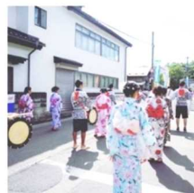
2022. 1. 13付【大野の伝統的な盆踊り「ナニヤダヤラ」】