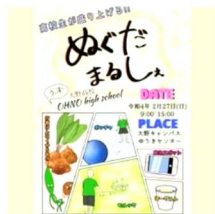
2022. 1. 20付【2/27(日)開催「ぬぐだまるしえ」ポスター】