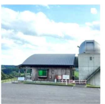
2021. 12. 28付【ひろのまきば天文台と、大野地区共同利用模範牧場】