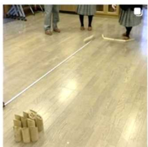
2022. 1. 21付【ぬぐだまるしえ:スポーツ大会の魅力! in おおのキャンパス