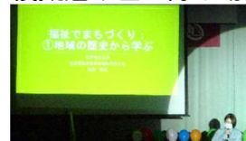
高大連携「福祉でまちづくり」