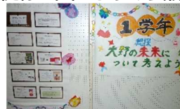
1年「大野の未来を考えよう」