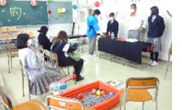
2年縁日&マジックショー