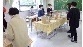
雨天のため模擬店は屋内に