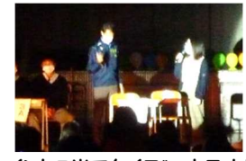
イントロ当てクイズ～カラオケ