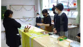
1年行者にんにく唐揚げは売完