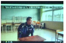
クラスビデオ上映