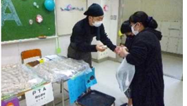
松茸おにぎりを来場者に配付