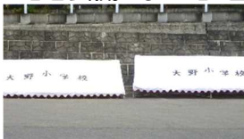
大野小学校さんに感謝

10/15.16 に、大野高祭を開催しました。今年度は同居家族等の関係者に、体調チェックシートを提出していただき公開しました。生徒は、久しぶりの公開行事とあって、張り切って模擬店や出し物の勧誘をしていました。