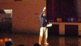
エンタイングセレモニー