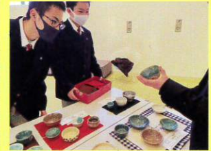
総合文化祭の工芸展示