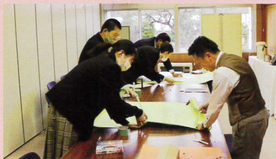
研究成果の発表準備

令和2年度1学年の「総合的な探究の授業」では、地域活性化をテーマとして大野地域の特色を研究し、乳製品等の特産品を用いた商品提案・販売をしました。