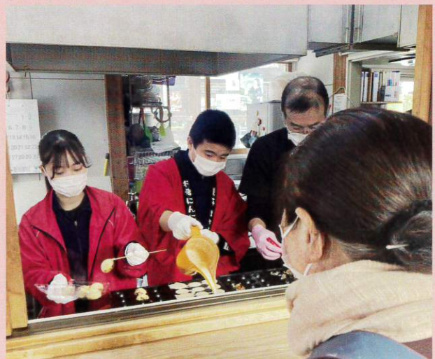
大野の行者にんにくを使用したたこ焼きの販売