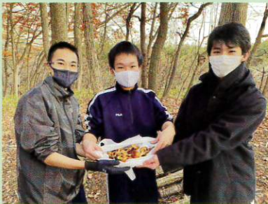
総合文化部のナメコ栽培

初夏から秋にかけて久慈平岳の里山整備を全校で行います。秋のマツタケ収穫を通し、自然の恵みや尊さを実感できます。地域の方々や保護者からの温かい支援をいただきながら活動しています。