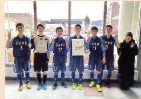
サッカー部 (R3~募集なし)