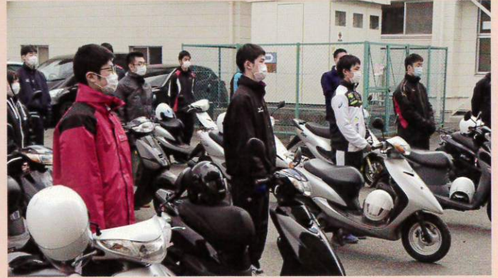
交通安全実技講習会