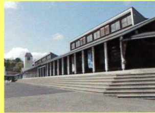
産業デザインセンター

大野地域は木工産業が盛んで、大野高校では「工芸」を学ぶことができます。高校近くの「産業デザインセンター」の御協力のもと、木工をはじめとした陶芸やさき織りなどの学習ができます。作品は、大野高祭や洋野町文化祭、久慈地区高等学校総合文化祭などで展示されます。