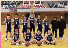
バスケットボール部