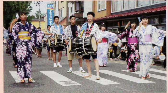
ナニヤドヤラ大会