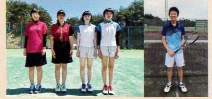
男女ソフトテニス部