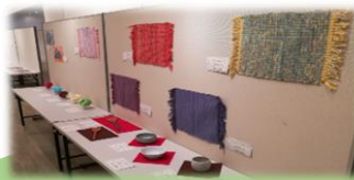
総合文化部 手芸・工芸作品

総合文化部 手芸8作品・工芸8作品(1・2年) 工芸(授業) 32作品(1~3年)