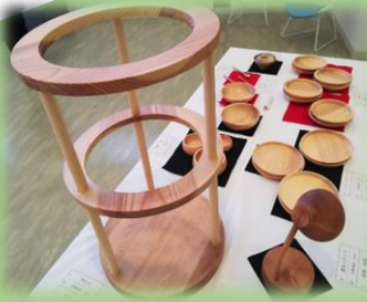
工芸(授業) 木工作品