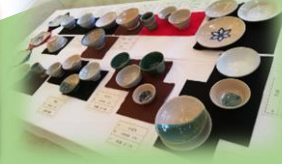
工芸(授業) 陶芸作品