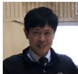
久慈工業(4年)→盛岡市立(11年) →葛巻(2年)→国体推進室(2年)→ 盛岡三(6年)→県教委スポーツ健康 課(5年)→盛岡三(2年)→本校

さて、35 名の新入生を迎え、大野高校の新年度がスタートしました！歴史と伝統があり、地域の皆様に愛され、支えていただいていた大野高校が、さらに大きく飛躍し、新たな歴史を刻んでいけるよう、教職員とともに頑張っ参りますので、ご支援ご協力をお願いします。