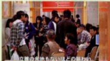
立派の家柄もないほどの賑わい

全てにおいて前回よりパワーアップされた東高祭。2日目は雨模様で餅まきが餅振る舞いだけになってしまいましたが、餅を受け取ったお客さんも生徒も笑顔でした。