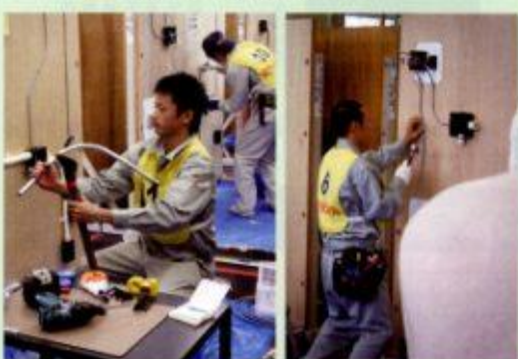
高校生ものづくりコンテスト