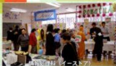
チャレンジショップ「イーストア」