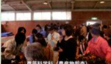
農芸科学科 (農産物卸売)