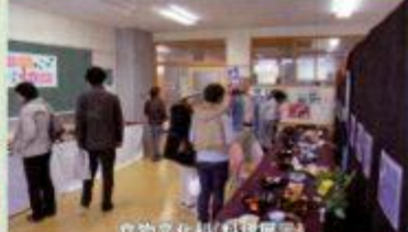
食物文化科(料理展示)