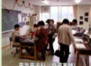
電気電子科 (感電実験)