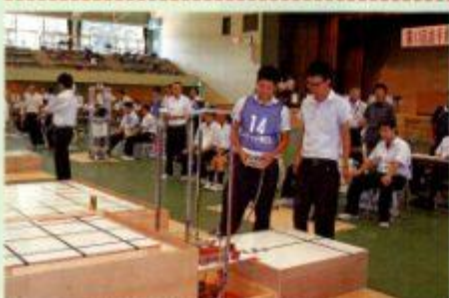
ロボット競技大会 (真剣そのもの...)