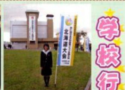
農業鑑定競技が終わり、ほっとしているところ。