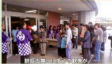
餅振る舞いと多くの笑顔が