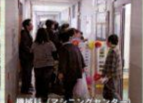
機械科 (マシニングセンター)