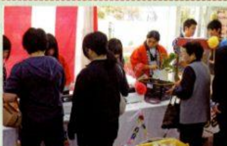
チャレンジショップ「イーストア」盛況