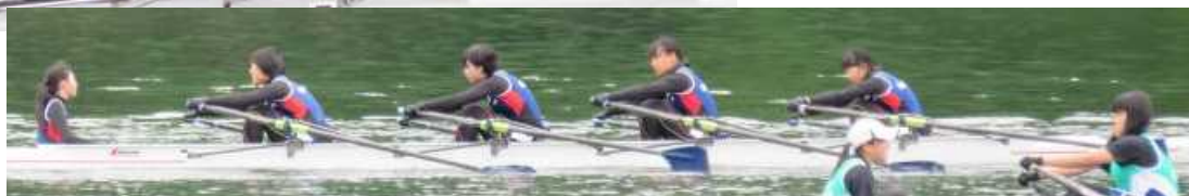
女子舵手付きクオドルブル(写真奥が西和賀高校)