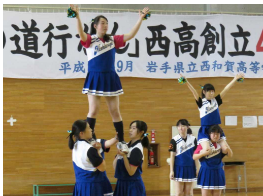
チアリーディングパフォーマンス

西和賀高校は小規模校の良さを活かし、生徒一人ひとりの夢を叶えるきめ細やかな指導を行います。皆さんも学習や部活動、本校独自の海外派遣等の各種研修、様々な生徒会行事で活躍して大きく成長し、国公立大学、医療系大学、就職等の進路目標を達成しましょう。