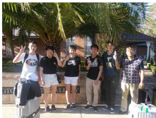
海外派遣（オーストラリア）の様子