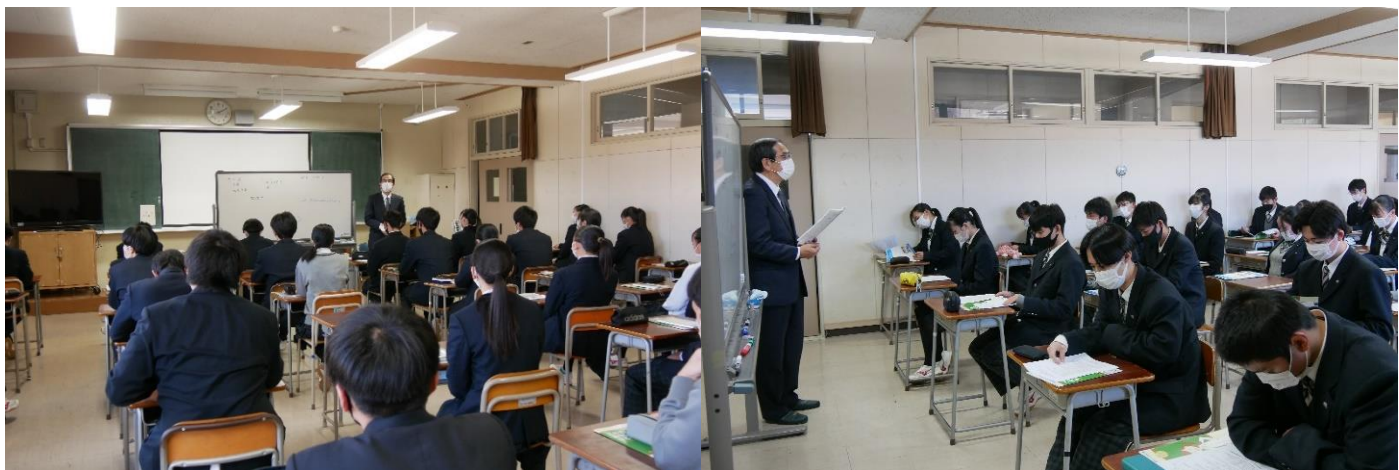
令和3年11月17日(水)3年生を対象に金融セミナーが行われました。