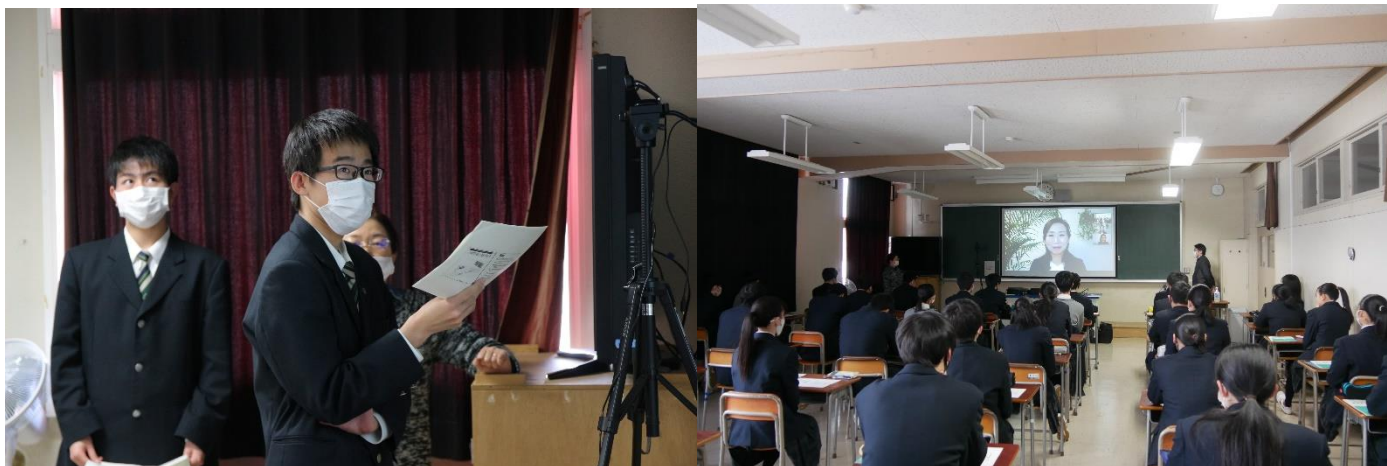
2校時からは1年生(2年生は模試)