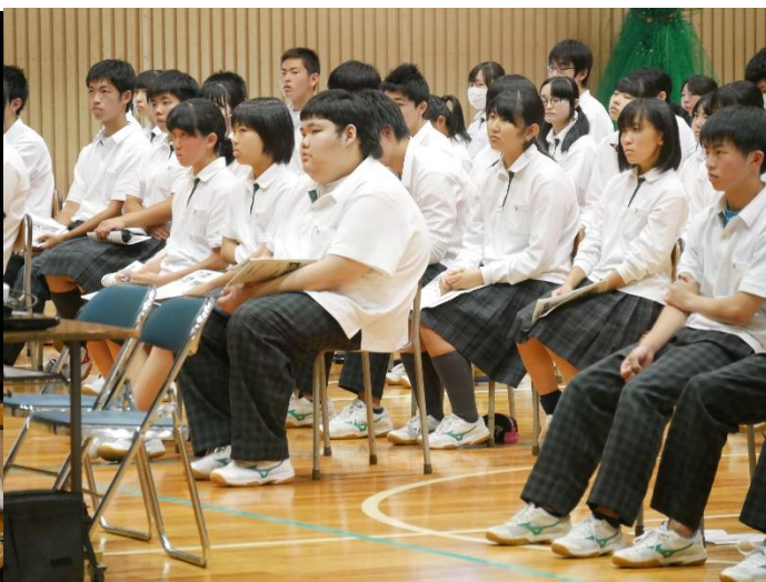
後ろに座っているのは進路委員の生徒