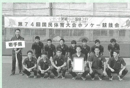
第74回 国民体育大会ホッケー競技 少年男子第4位