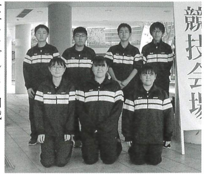
女子シングルス2回戦