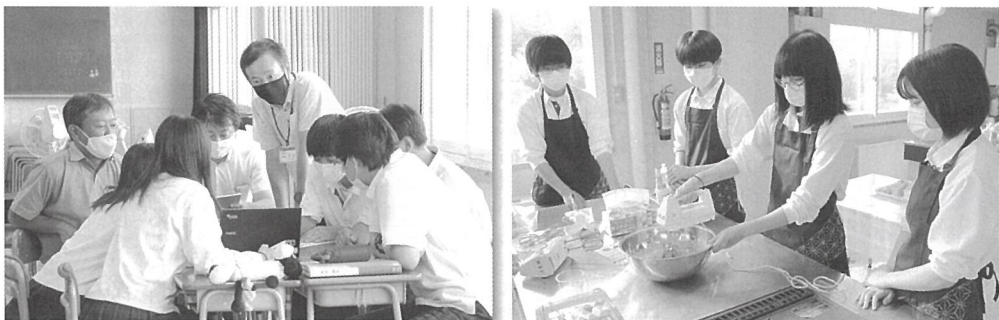
総合的な探究の時間

ウイルスによる対応等に追われながらも指導して頂いた事に感謝申し上げます。今後も皆様のご多幸と本校の益々の発展を祈願いたしまして、挨拶とさせていただきます。一年間、本当にありがとうございました。