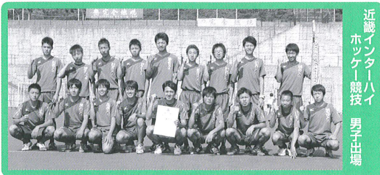
近畿インターハイ ホッケー競技 男子出場