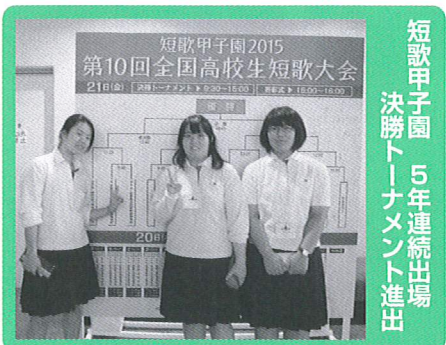
短歌甲子園 5年連続出場 決勝トーナメント進出

A活動に多大なるご協力いただき感謝申し上げます。特色ある学校の姿が求められている昨今、「沼高は大きな転機を迎えている」といっても過言ではないと思います。子供たちの活躍に負けないよう、私たちもPTA活動に取り組みんでいきたいと思います。保護者の皆様には、感謝申し上げますとともに、引き続きご支援ご協力を賜りますよう、お願い申し上げます。