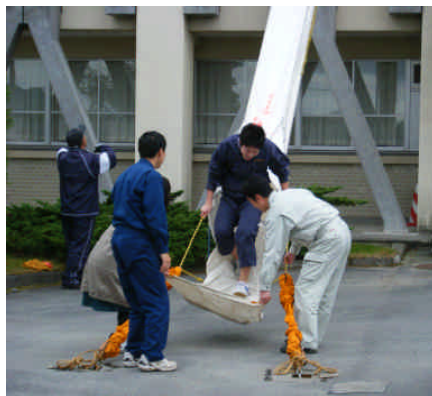
斜降式救助袋避難訓練