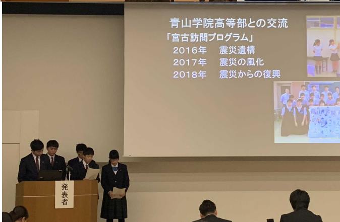
青山学院高等部との交流事業から学んだこと。今後の具体的な課題への取り組みを考えました。

『みやきた新聞』は、地域の皆さまに宮古北高等学校の姿を伝えるための発行を始めた。情報発信紙です。学習や様々な行事に生きた姿を掲載させていただきます。