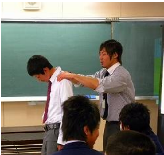
リラックスは大切なのです

五月十九日(木)、全校生徒を対象として、ストレスについての基礎知識と、心身をリラックスさせる方法をテーマとした「こころのサポート授業」を行いました。新潟県から派遣していただいた学校支援力カウンセラーの協力を得て実施されたこの授業は、東日本大震災後の生徒のストレス緩和を狙ったものです。授業後には、「習ったことを試してみたら、夜ぐっすり眠ることが出来た」などの声が聞かれました。教職員にとつても、生徒の心のケアについて、専門家の支援を受けながら学ぶことができる良い機会だったと思えます。