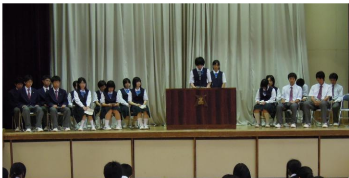
緊張の立会演説会