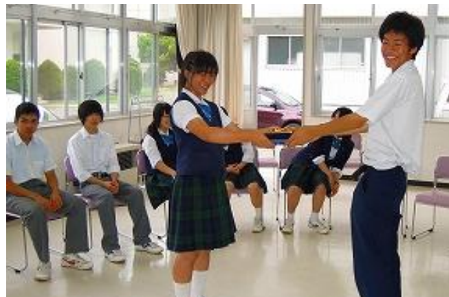
不来方高校のみなさんから義援金をいただきました