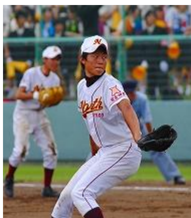
力強いピッチング!!

大会二日目(七月十五日)一回戦、本校野球部は北上翔南と対戦し、〇対一〇で敗退しました。こちらが自分たちのペリスを掴む前に、初回に大量得点を奪われ、その後も試合の流れを引き寄せられられないまま追加点を献上し、無念の試合終了となりました。