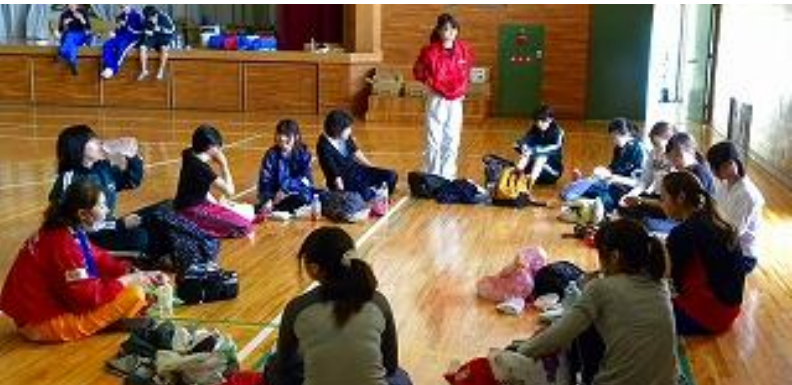
今日のボランティアの打合わせ

また、同学の音楽サークルであるニューオーリンズ・ジャズ・クラブ(NOJC)も被災地を慰問する活動を行っています。宮古駅前や三陸鉄道の走行する車両内で演奏活動を行い、本校の吹奏楽部員に技術指導をしていただきました。最後に、全員で合奏した『聖者の行進』は部員にとつて忘れられない思い出となりました。