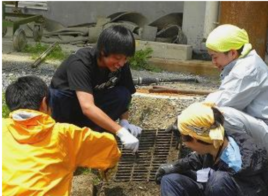
早稲田大学のみなさん、ありがとうございます