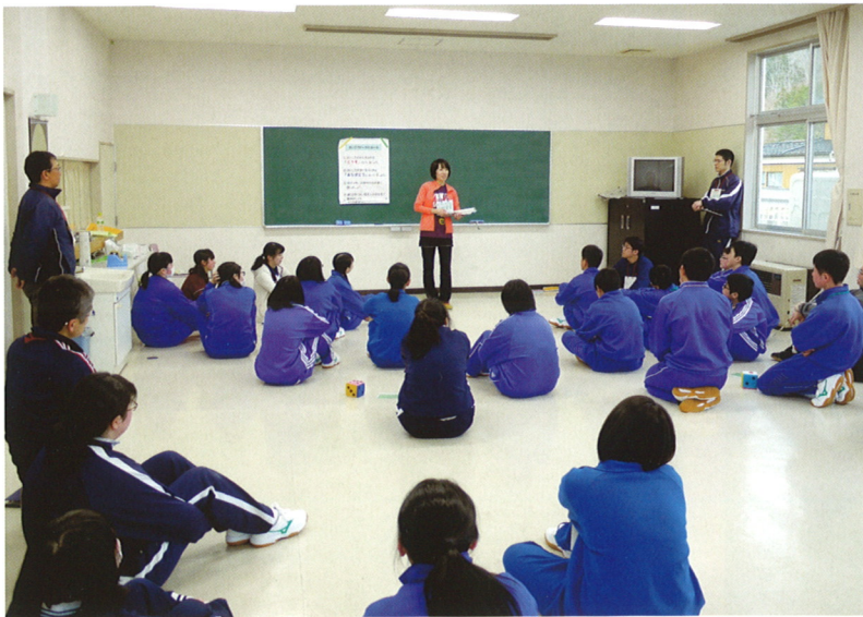
新入生研修 (グループワーク)