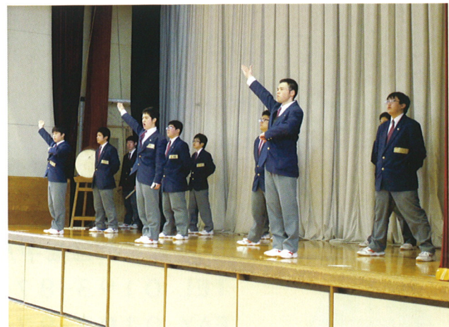
2月 応援団リーダー研修