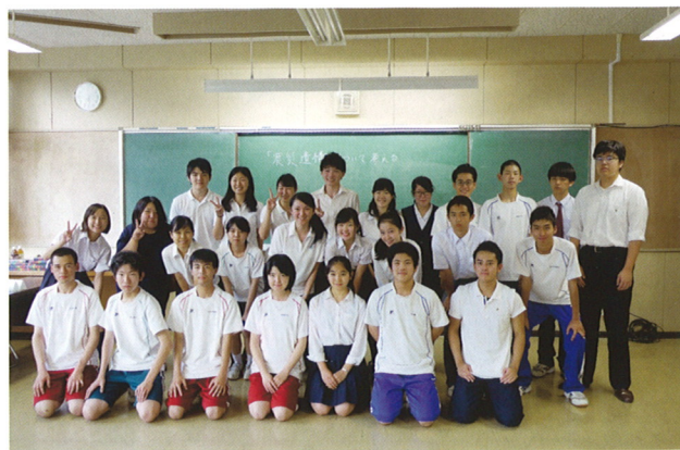
青山学院高等部との交流