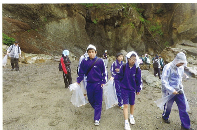
ボランティア活動（海岸清掃）