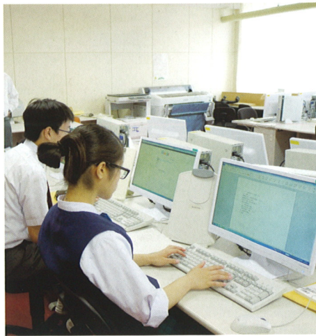
ビジネスコース 授業風景