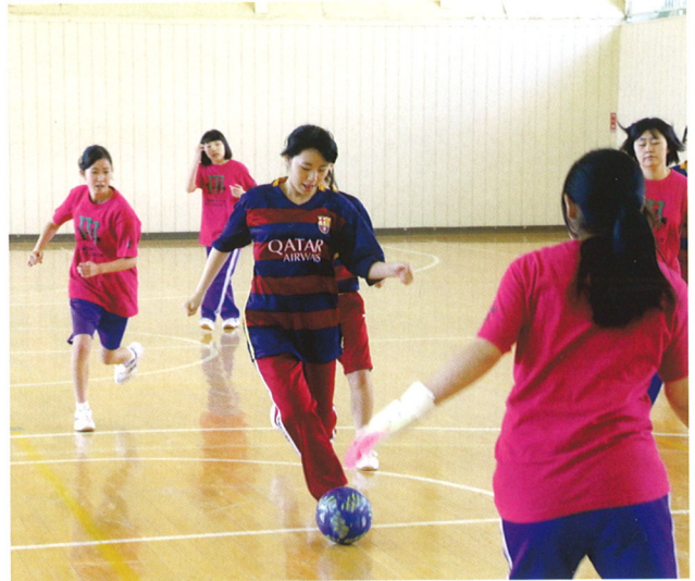
6月 オリンピア(体育祭)