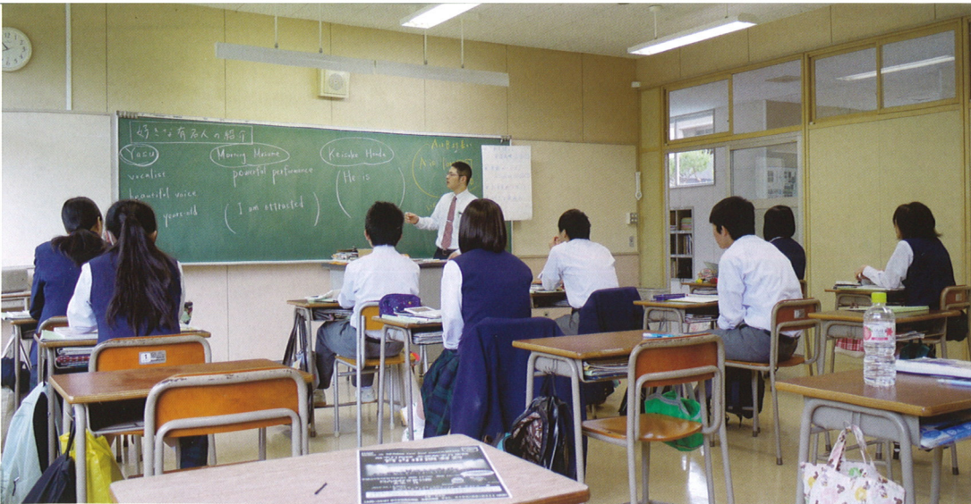
進学コース 授業風景