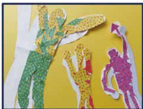
「応援」 久慈拓陽支援学校 高等部 共同作品