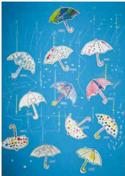
「水玉で傘をデザインしよう」 花巻清風支援学校 中学部1年 共同作品

これからは、自分の体調を崩さないように職場に行って働いて給料をもらっていきたいです。三愛で学んだことは色々ありますが、私は特に自分から相談するようにして作業を行うことができるようになりました。学校を卒業した後、今働いている職場でも従業員や上司の方に悩んでいることを素直に話し、仕事を行っています。もしも三愛に入学していなかったら今の私がいらないと思います。将来の夢はまだ考え中ですが、お金を貯めていつか何かを試してみたいです。