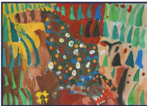
「今にも何かを食べてしまいそうなワニ」