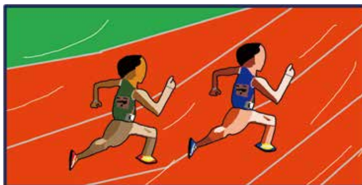
「dash!!」 気仙光陵支援学校 中学部