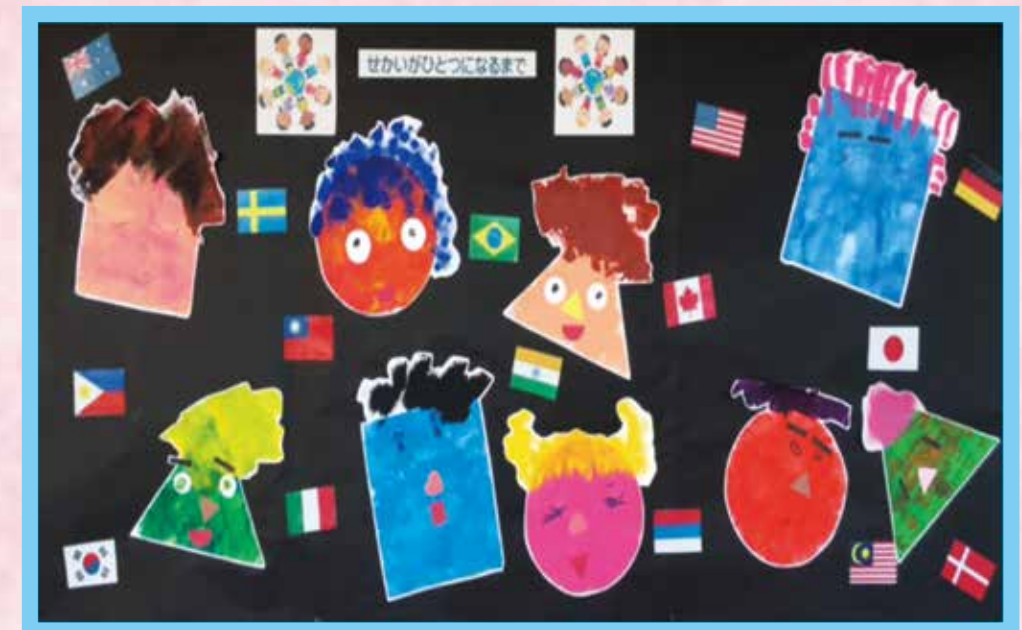
「せかいがひとつになるまで」 岩手県立前沢明峰支援学校 小学部2・3年 共同作品

岩手県特別支援学校連絡協議会 [協力]岩手県特別支援学校PTA連合会 [主管]岩手県立宮古恵風支援学校