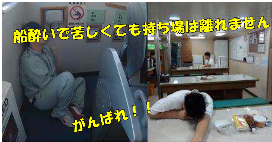
船酔いで苦しくても持ち場は離れません