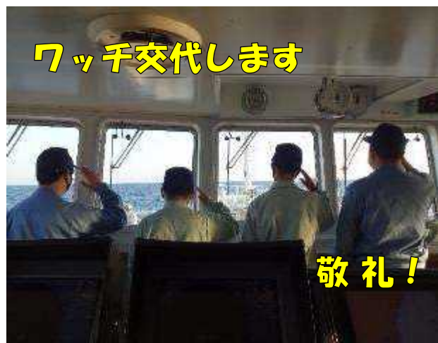
ワッパ交代します

1月21日(木) 宮古港を出港した「りあす丸」途中、石巻市に寄港し船体整備をしたのち一路漁場へ向け沖だしとなります。風が悪く経験したことのない揺れで酔いを感じながら実習生は、専攻科と一緒に航海当直、食当と課業と頑張っています。