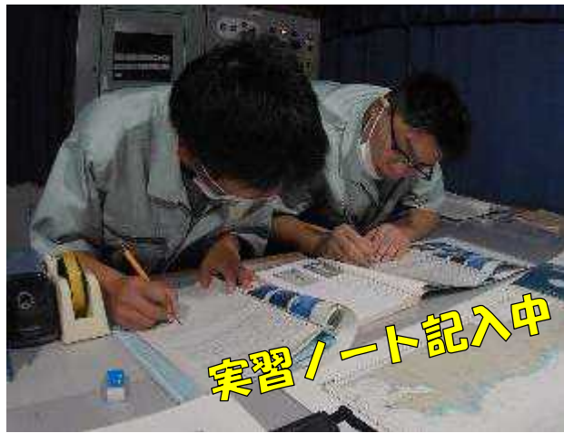
実習ノート記入中