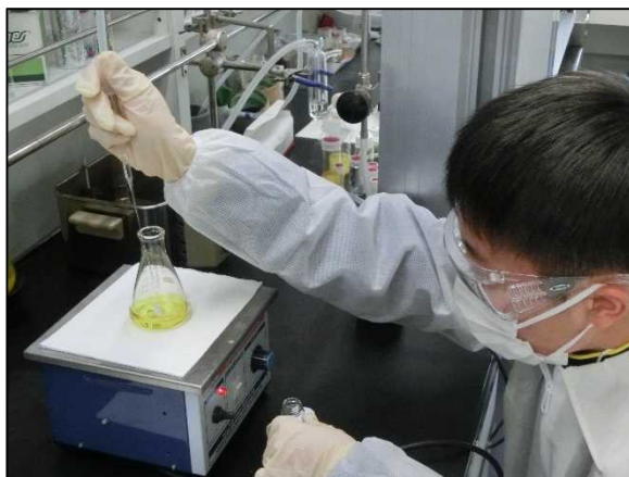
Alq3 を合成しているところ