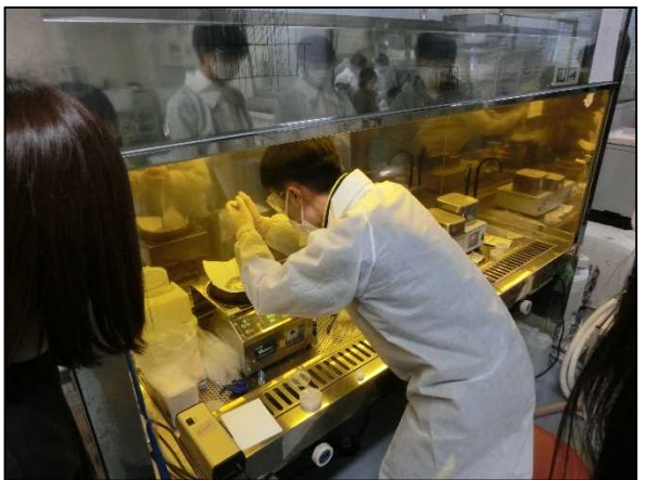
スピコート法で塗布している様子