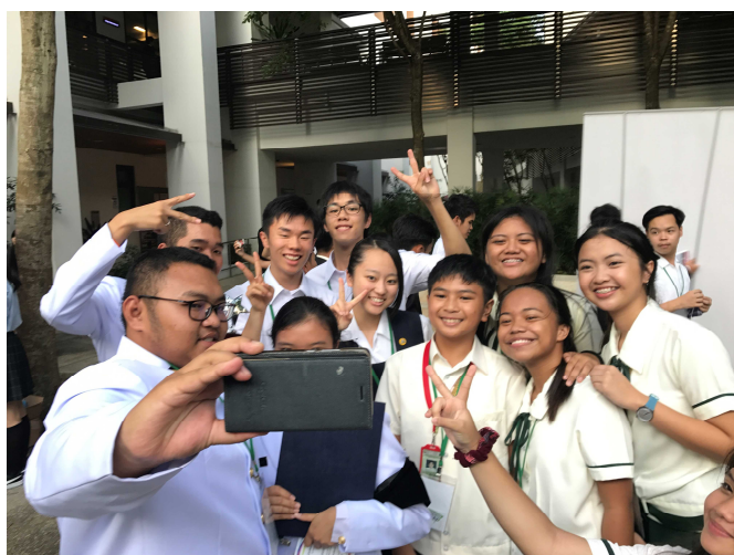
参加者全員で集合写真