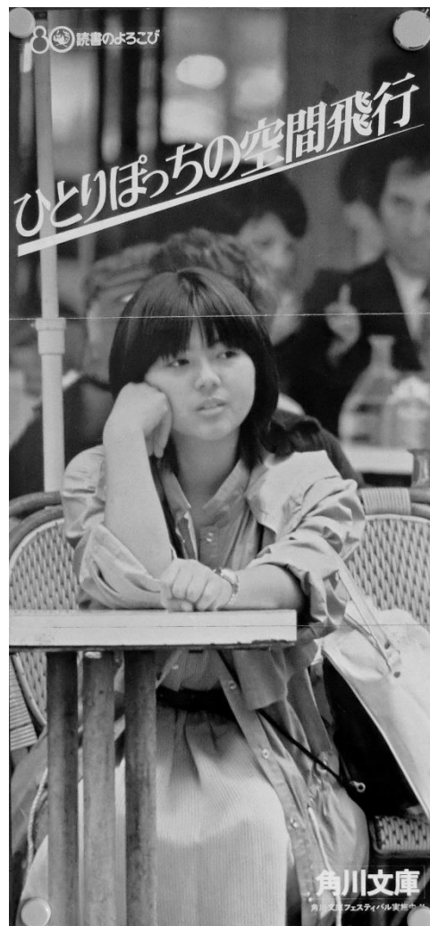
↑ 今も大切にしている角川文庫の宣伝ポスター このほかにも2枚ある

ずっと金沢に行きたいと思いながら行けずにいる。これを話すと「金沢いい街ですよね… ひがし茶屋街とか21世紀美術館とかあるし、冬はカニもおいしいですよね…」などといわれるが目的は全くそこでない。『野性の証明』のロケ地があるからだ。金沢の小さなY字路に高倉健と薬師丸ひろ子がいる場面が、その陳腐な街並みとと