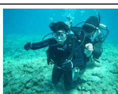
体育科マリン実習