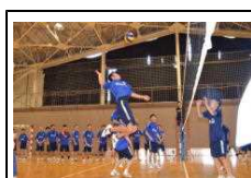
校内スポーツ大会

文化部では吹奏楽部、音楽部、軽音楽部、書道部、美術部、演劇部、写真部などが精力的に活動しており、今後の活躍が期待されています。