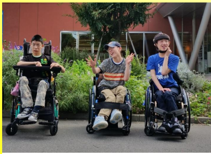
東京 BumB（宿舎）の前で 皆さん良い表情です。