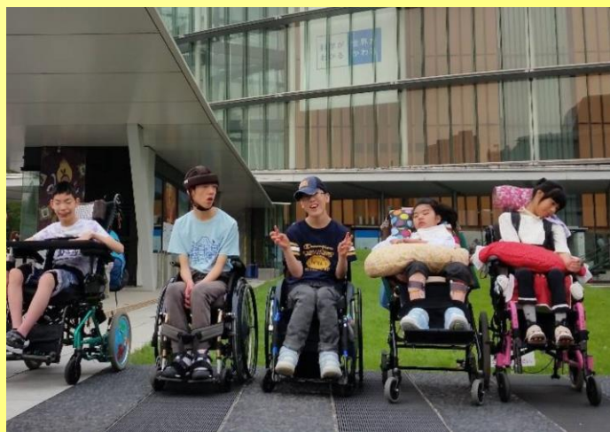
日本科学未来館に行きました。 館内には、ロボットもいました。