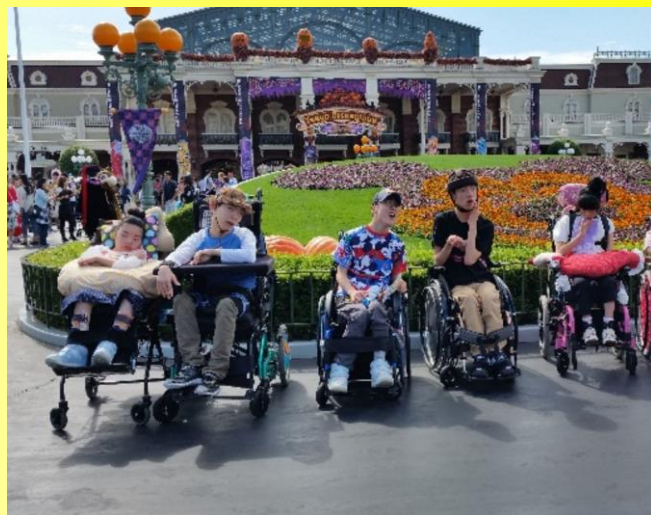
ディズニーランド入り口にて、記念撮影。 花壇には、お花のミッキーマウスがいました♪