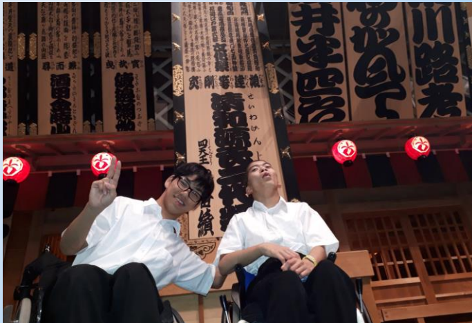
初日は江戸東京博物館へ。芝居小屋・中村屋の前での1枚です。江戸東京の歴史と文化を学ぶことができました。