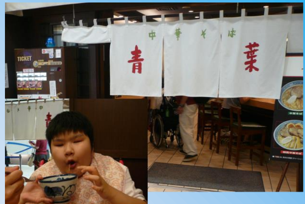
2日目は自主研修でサンシャイン池袋に行き、昼食は「中華そば青葉」のラーメンを美味しく頂きました！