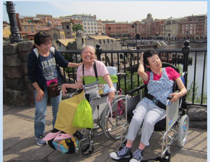
3日目は「東京ディズニーシー」へ。天気にも恵まれ、目標のキャラクターにも会って大満足の日でした。