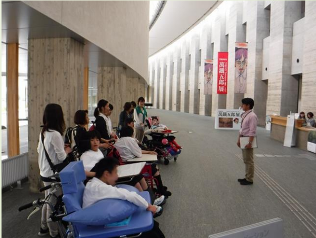
県立美術館に行ってきました。