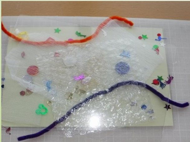
このような状態から