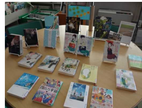
「夏だ!海だ!読書だ!」のコーナー

図書委員会は、カウンター付近を四季折々のディスプレイで 明るく利用しやすい図書館にしています。 また、図書館にある本の検索もしますので カウンターにいる図書委員に気軽に声をかけてください。