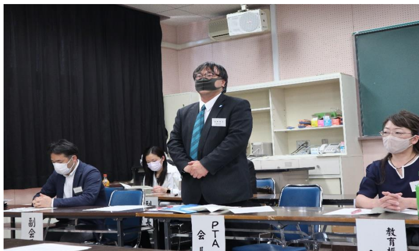
P T A 会長挨拶