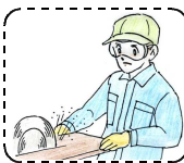
【 木 工 】