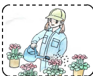
【 園 芸 】