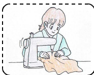
【 縫製デザイン 】