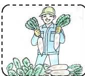
【 農 業 】