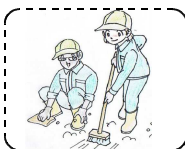
【 清 掃 】