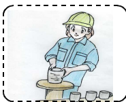
【 窯 業 】