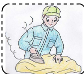
【 クリーニング 】