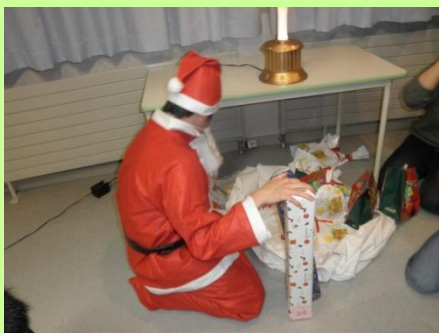
クリスマスパーティー