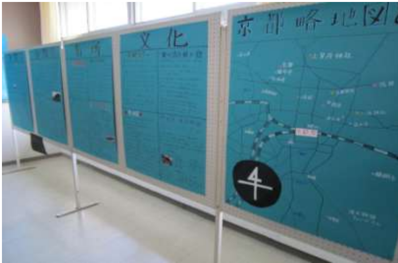
↑同じく旅行先である「京都」についてのレポート