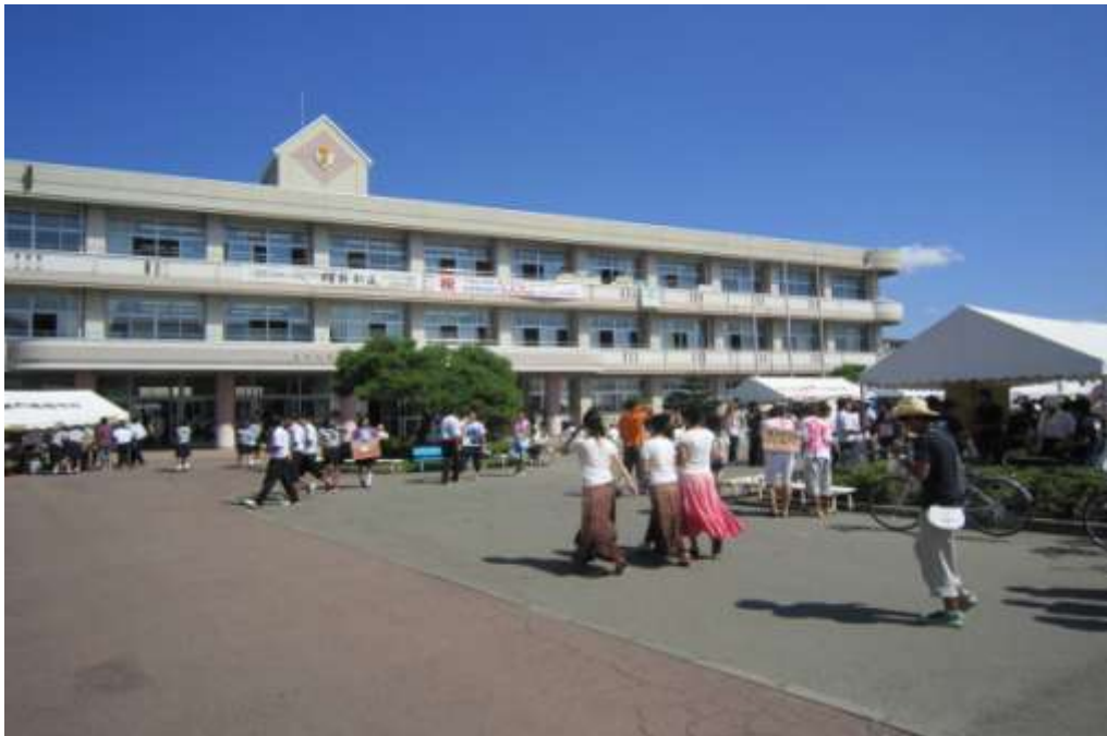
↑志高祭（校外）の様子