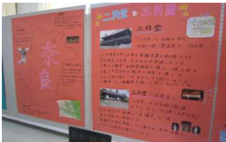
↑ 修学旅行の旅行先である「奈良」についてのレポート