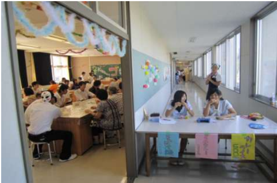
↑毎年人気(?)の食堂!今年はキッチン「ゴロリ」として開店していました。 新メニューに「そば冷麺」が加わって、心機一転!おいしそうです。