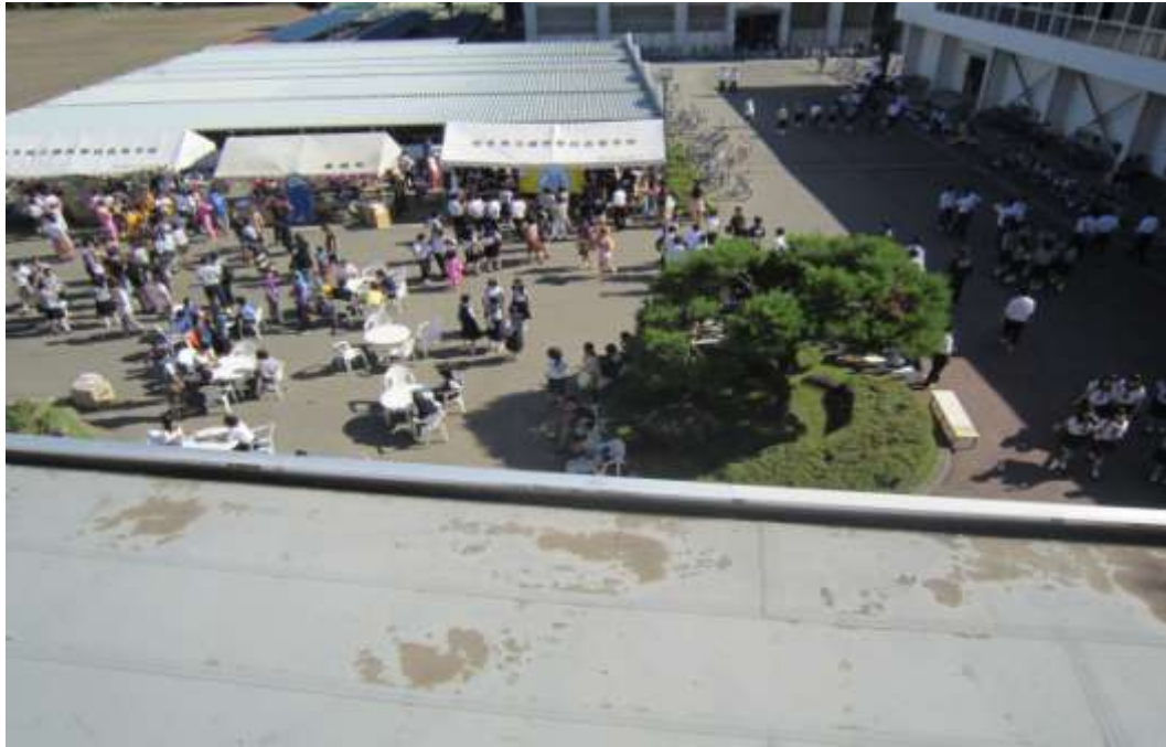
↑上から見た志高祭！