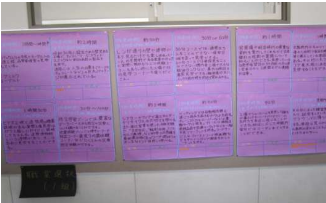
↑修学旅行で行くことになる様々な企業のレポート