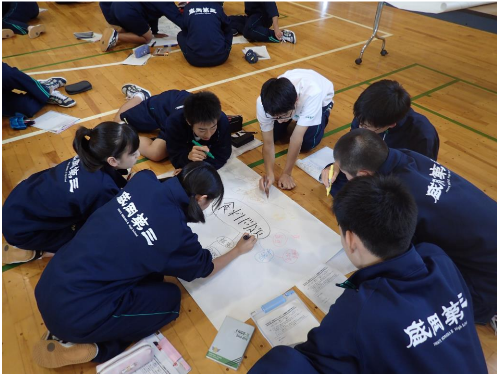
ブレインストーミングの様子