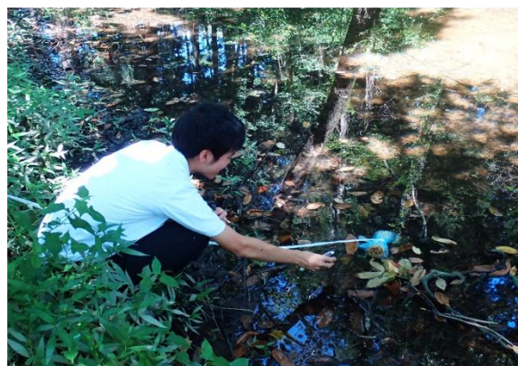
ゾウリムシ採取のための稲わらトラップ設置の様子