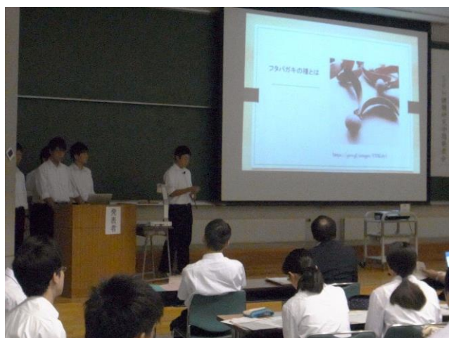
課題研究プレゼンの様子(物理2班)