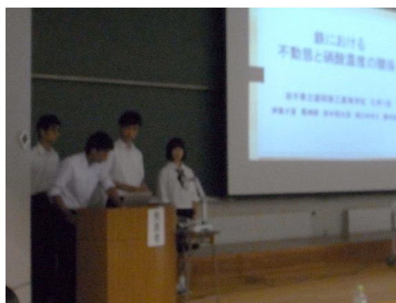
課題研究プレゼンの様子(化学1班)