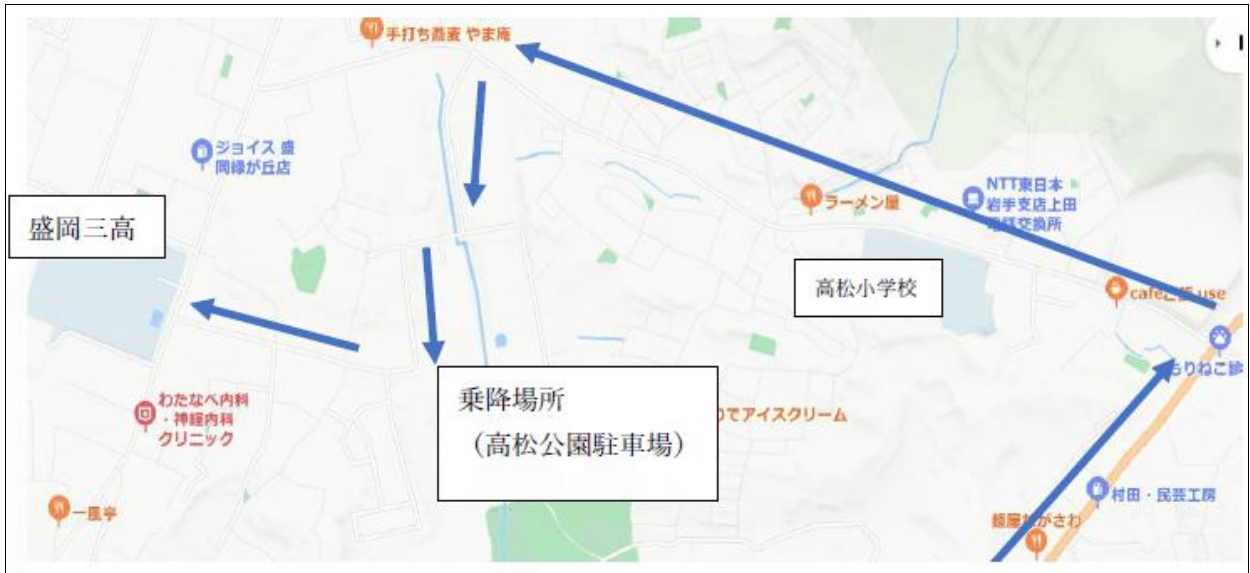
[図 2] 乗降場所への移動ルート(「→」は車の走行ルート)