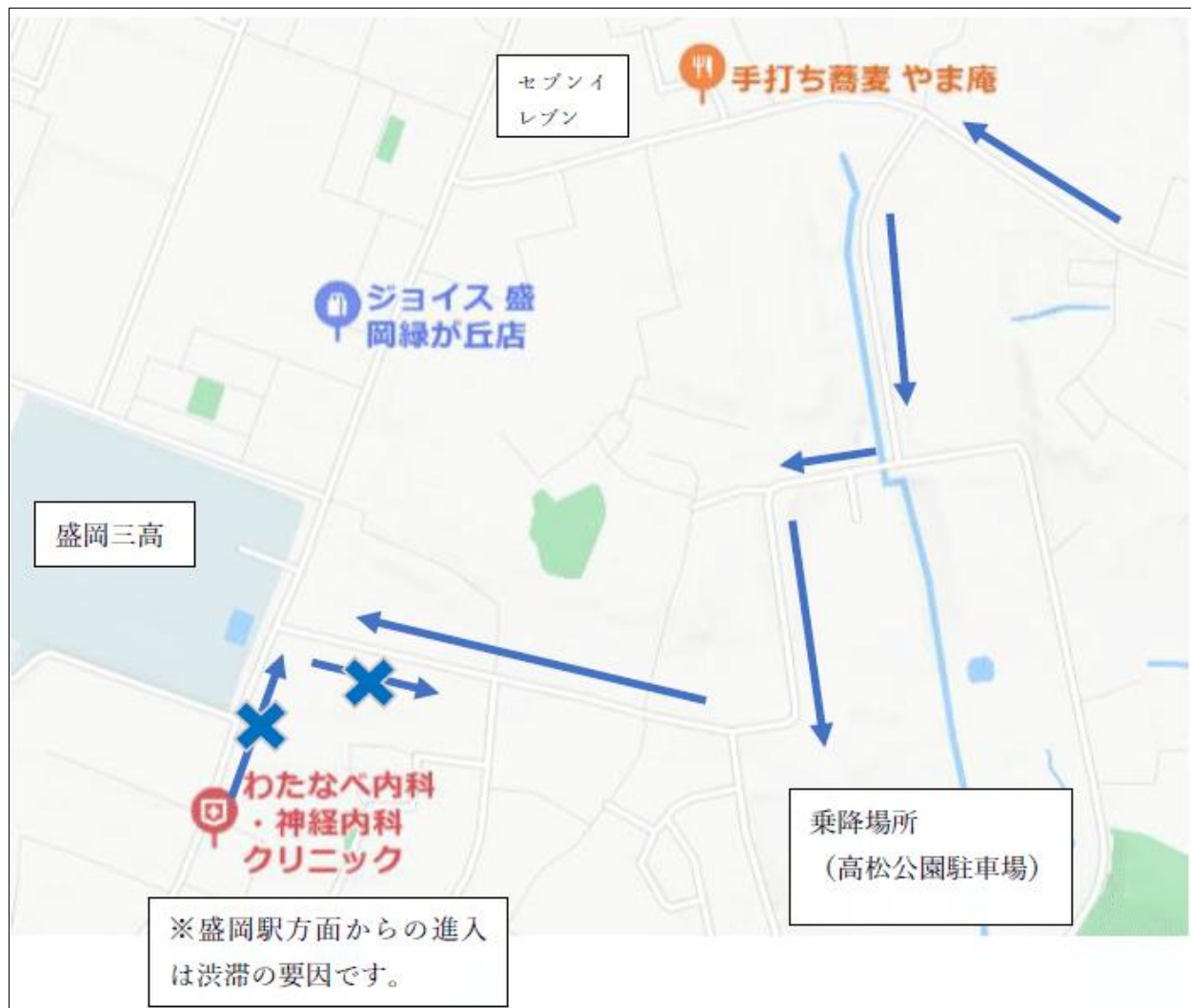
[図 1] 自家用車で来校する生徒の乗降場所（「→」は車の走行ルート）