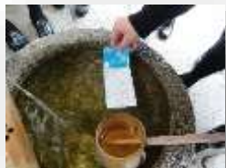
北野天満宮の 水みくじ