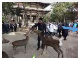
奈良公園にて 鹿の大群