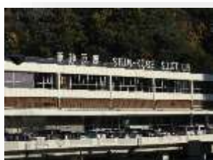
新神戸駅から 盛岡へ出発 帰りたくないな...