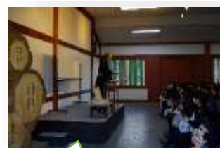
薬師寺 法話 YSJ最高!