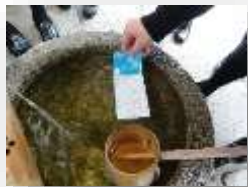
北野天満宮の 水みくじ