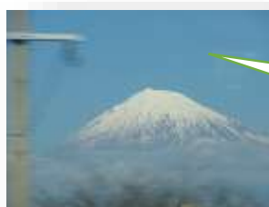
富士山がきれいに 見えました