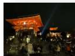
清水寺の 夜間拝観