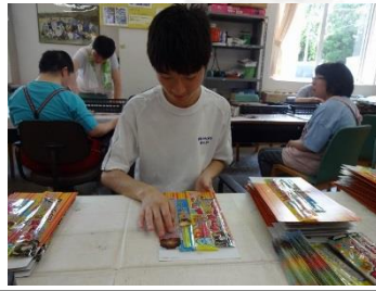
かし和の郷(花火のシールはり)