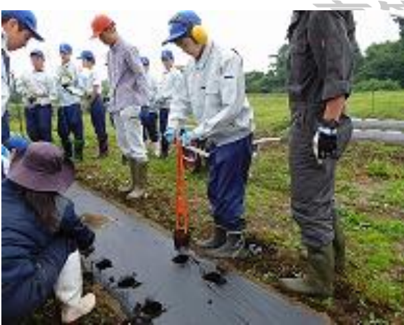
岩手大学滝沢農場での農業体験実習

高等部前期実習が終わりました。1学年は校内での2週間(6/19~6/30)、2学年は現場での実習を2週間(6/19~6/30)、そして引き続き、3学年も現場での実習を2週間(7/3~7/14)行いました。