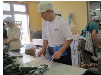
あすなる園(野菜の袋詰め)

<2・3年現場実習> 『やる気』 『元気』 『根気』 3つの気合いを入れて実習に取り組みました。