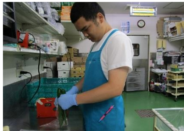
(株)マイヤ青山店(野菜の袋詰め)