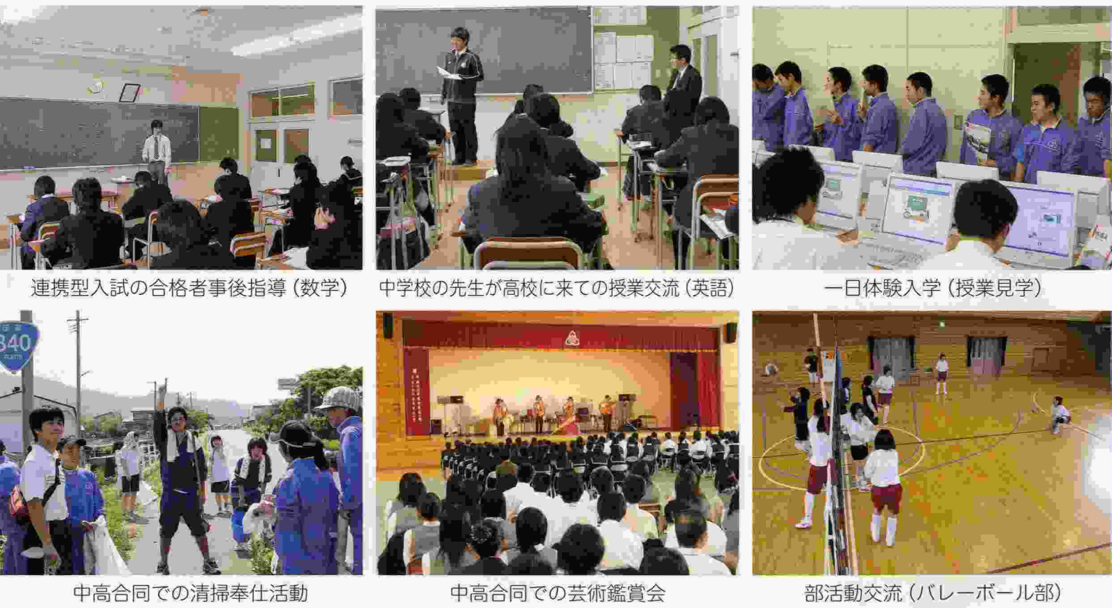
連携型入試の合格者事後指導(数学)