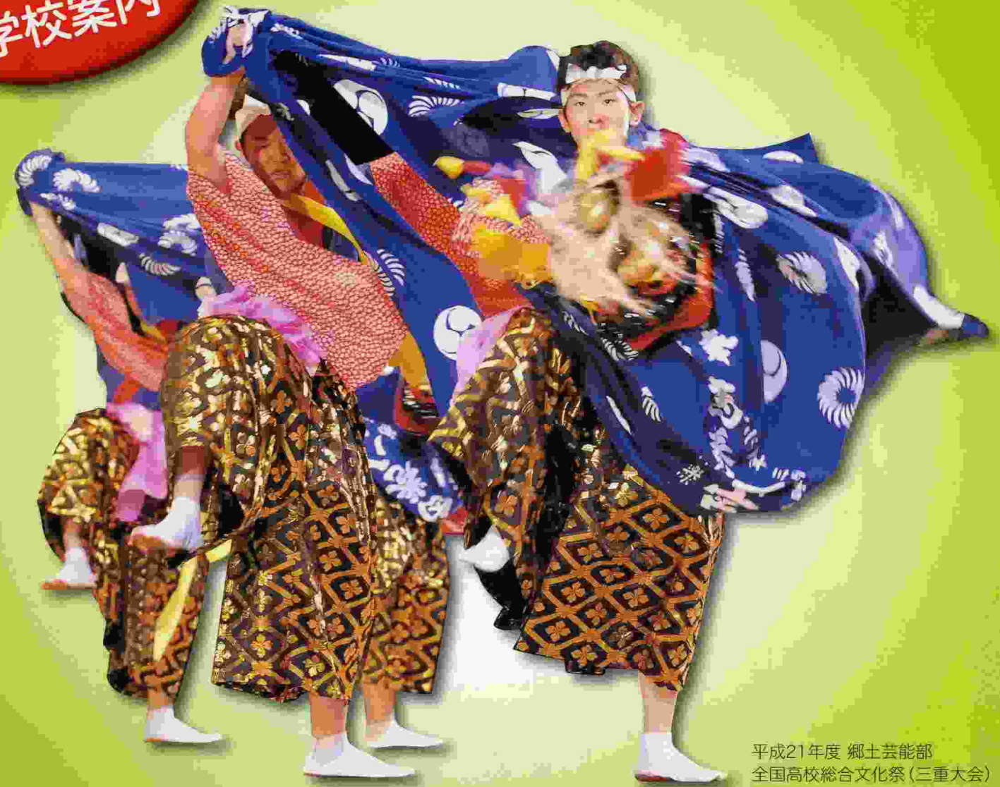
平成21年度 郷土芸能部 全国高校総合文化祭(三重大会)