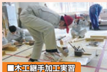
■木工継手加工実習