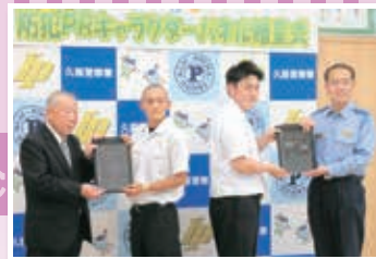
防犯PRキャラクターパネル贈呈式

全国区で活躍しています。 クラブ活動で 充実の高校生活。 久慈工業高校は 地域での活動が 高く評価されています。