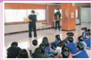
野田小読み聞かせ