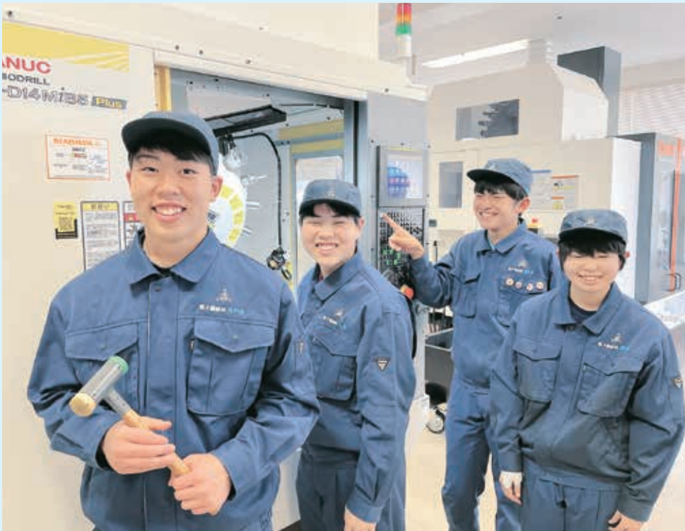
マシニングセンター（県内初2台目導入）

進路を考え、機械・電子機械の2つに分かれて、専門授業を学習します。実習はより実践的な作業を総合的に学習します。製図は3D-CAD（コンピュータを使った三次元製図）を学習します。