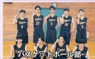
バスケットボール部