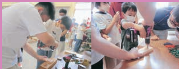
小学生ものづくり教室