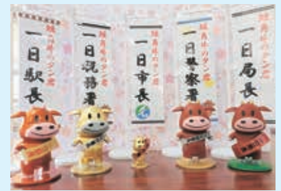
地元キャラクター