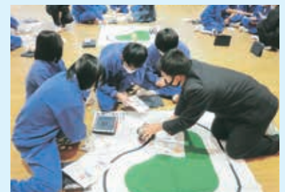
出前授業 ～プログラムで遊ぼう～