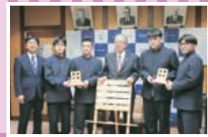
野田村イーゼル贈呈式