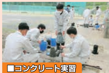
■コンクリート実習