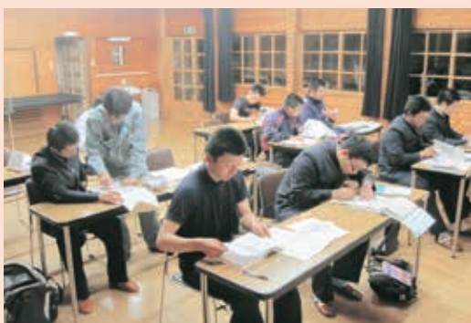
国家試験対策講習