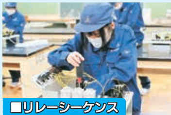
■リレーシーケンス