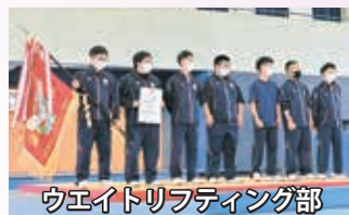
ウエイトリフティング部