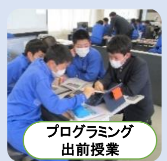
プログラミング出前授業