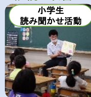
小学生読み聞かせ活動