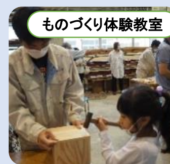
ものづくり体験教室