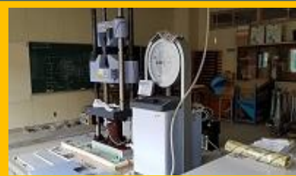
万能試験機 新しくなりました。