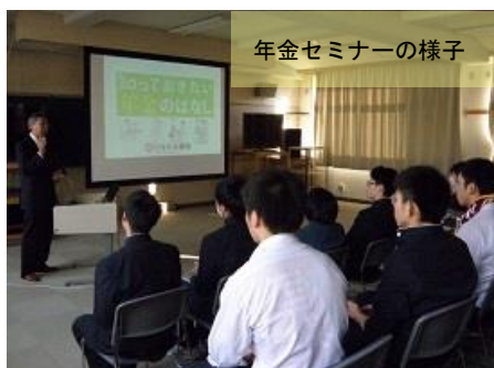
年金セミナーの様子