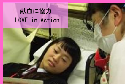
献血に協力 LOVE in Action