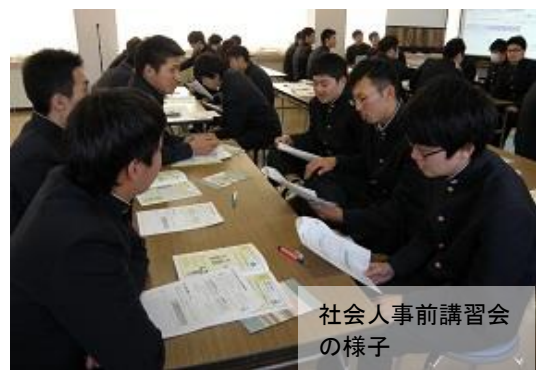
社会人事前講習会の様子

3年生を対象に、12月4日(火)に「年金セミナー」を、12月11日(火)に「社会人事前講習会」を開催しました。「年金セミナー」では、講師